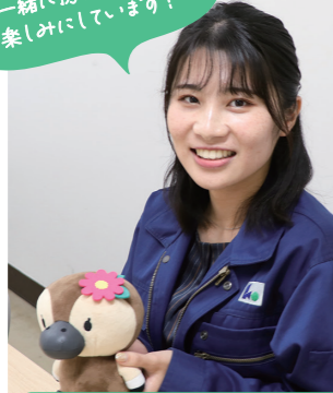
One Day with Me ある一日のスケジュール