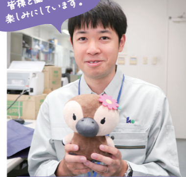
One Day with Me ある一日のスケジュール