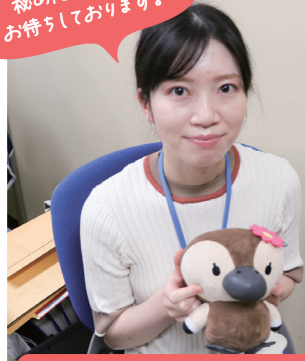
One Day with Me ある一日のスケジュール