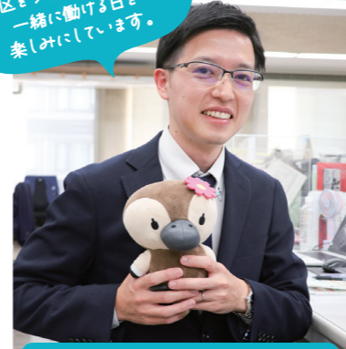
One Day with Me ある一日のスケジュール

共に暮らしやすい江東区をつくっていきましょう。一緒に働ける日を楽しみにしています。