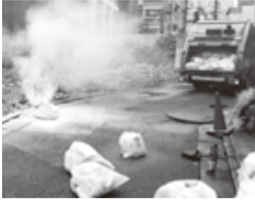
▲可燃ごみ回収中の火災の様子

不要になった充電式の小型家電を廃棄する際には、燃えないごみの日またはお近くの家電回収ボックスにお出しく下さい。