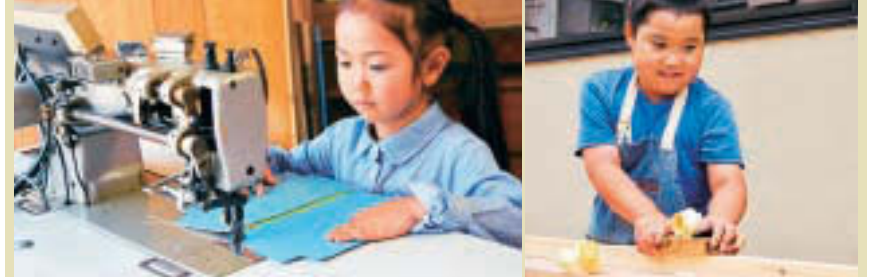
▲オーダーメイド革職人の仕事 ▲ハウジングプランナーの仕事

子どもたちに地域を支える企業を理解し、仕事への興味を持ってもらうため、区では「JTB旅いく×アウトオブキッズニアin KOTO」事業を行っています。これは、豊洲で子ども向けの職業・社会体験施設「キッズニア」を運営するKCJ GROUP(株)と区内の中小企業が共同でものづくり体験プログラムを開発し、未来を担う子どもたちに楽しみながら仕事にチャレンジしてもらう事業です。職人の技に間近で触れ、楽しみながら地場産業を学ぶことができます。夏休みの自由研究や思い出づくりにもオススメです 時 「旅いく」特設ページをご覧ください 場 下表のとおり 申 (株)JTBが運営する「旅いく」サイト内特設ページ(HP) https://tabi-iku.jtbbwt.com/feature/236 で 問 (株)JTB旅いく事務局(平日9:30~16:30)☎5371-8161、経済課産業振興係☎3647-2332、FAX3647-8442