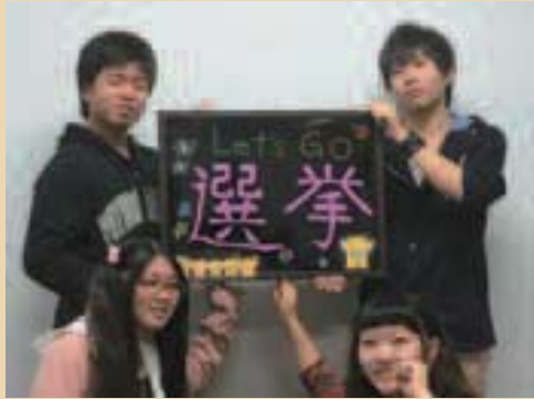
▲学生がツイッターで発信した画像