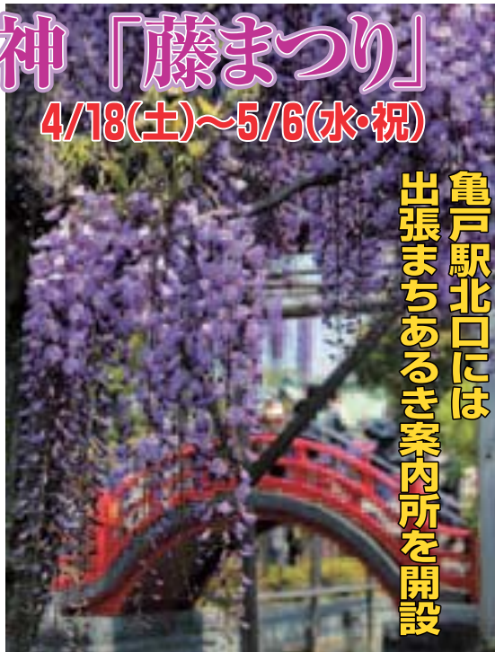
▲見事な藤の花が咲き誇ります

迎える時期にあわせ、「藤まつり」が開催されます。また、藤まつり開催にあわせて、下表の期間、江東区文化観光ガイドが地域の魅力をご紹介します。「出張まちあるき案内所」を亀戸駅北口に設置します。ぜひご利用ください。