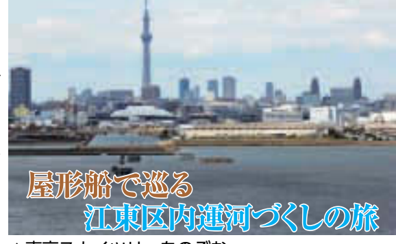
▲東京スカイツリーをのぞむ

リバーガイド認定者の解説とともに、初秋の水彩都市の魅力をとたつぷりとお楽しみください。 時 9月29日(日) 1便: 午前9時~午後0時半(予定)、2便: 午後1時~4時半(予定) ※荒天中止やコース変更あり