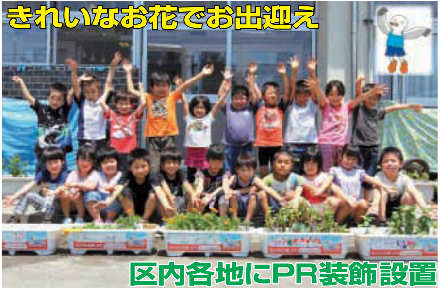
▲みんなで一生涯懸命育ててるよ! (大島保育園で)