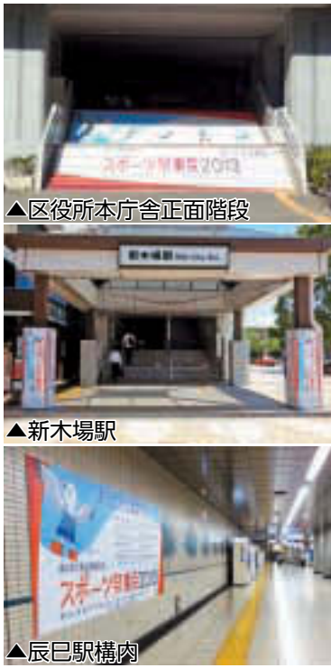
▲区役所本庁舎正面階段