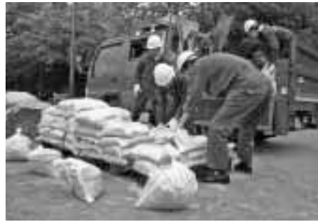
▲万一に備え、ご利用ください

もしものときの浸水被害に備えて 「土のう」は区指定日に配送 区では浸水被害を防ぐため、6～10月に毎月「土のう」を保管希望者に配付しています。台風接近時等の当日を含む直前対応は困難ですので、ぜひこの機会をご利用ください。