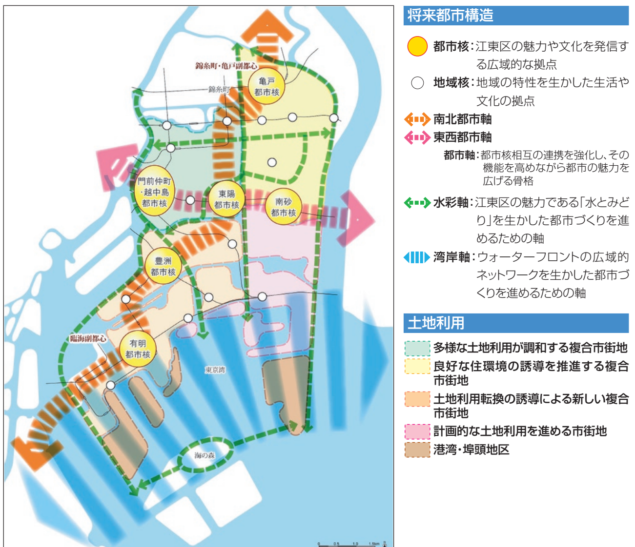
〈図〉 将来都市構造と土地利用

江東区は、住・商・工・業など多様な機能が複合し、市街地が形成されていることが特徴です。今後も予想される大規模な土地利用転換や社会経済状況の変化に対応するため、土地利用の大きな方向性を、市街地形成の経緯や現在の土地利用の特性を踏まえた5つの区分に大別して、まちづくりを誘導します。