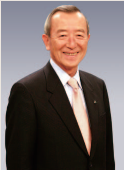
江東区長 山崎孝明